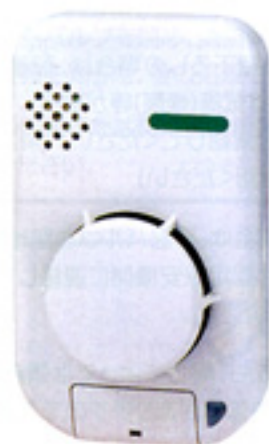
住宅用火災警報器(例)